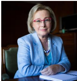
Graça Freitas General-Director of Health